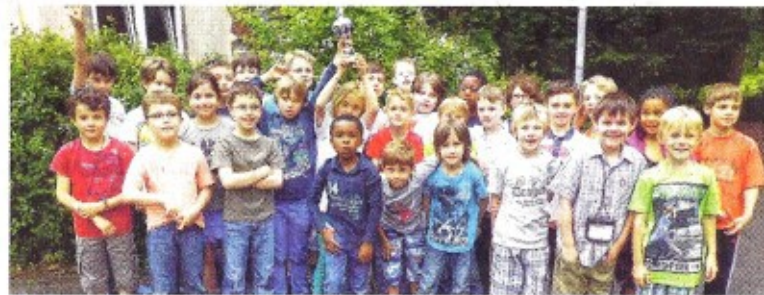
Die Sieger und Platzierten des Schachturniers.